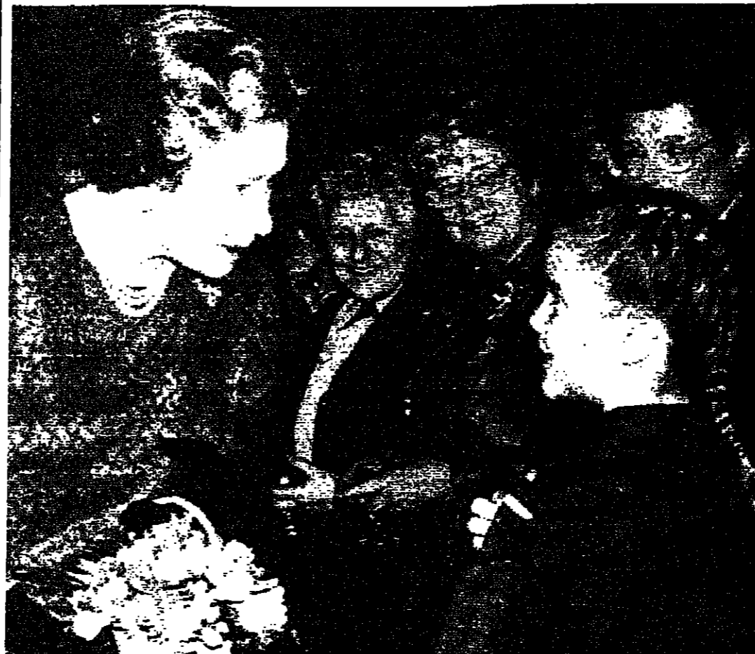
ملكة بريطانيا اليزابيث الثانية تستمع إلى الفتاة براونلي ليندي بيوزاس (٨ سنوات) وهي تتشرح مدلول الشارة على كفتها. بعد أن قدمت للملكة بقعة من الزهر. وكلمت الملكة